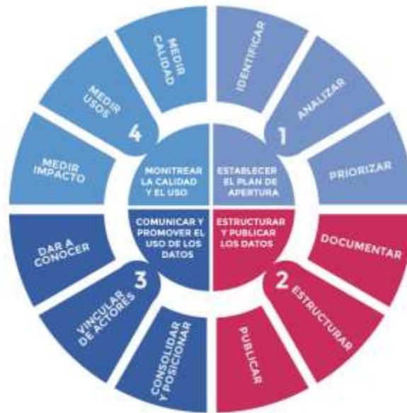
Ilustración 2: Ciclo de vida de los datos.