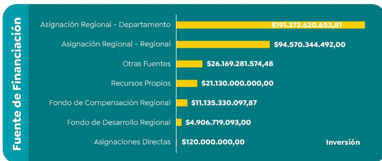
Gráfico 2: Fuentes de Financiación VALOR POR FUENTE de financiación

Fuente: Elaboración propia inversión de recursos del Sistema General de Regalías 2020-2023