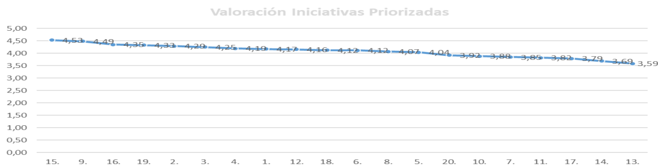
Gráfico 1: Puntuación iniciativa priorizada